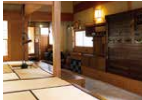
【左王舎】通り土間・いま8帖