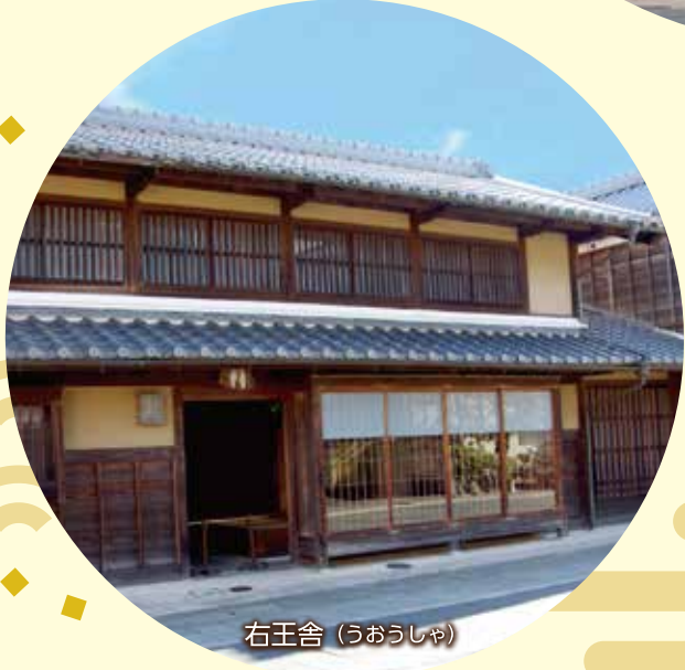
右王舎 (うおうしゃ)