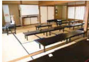
【右王舎】次の間・座敷