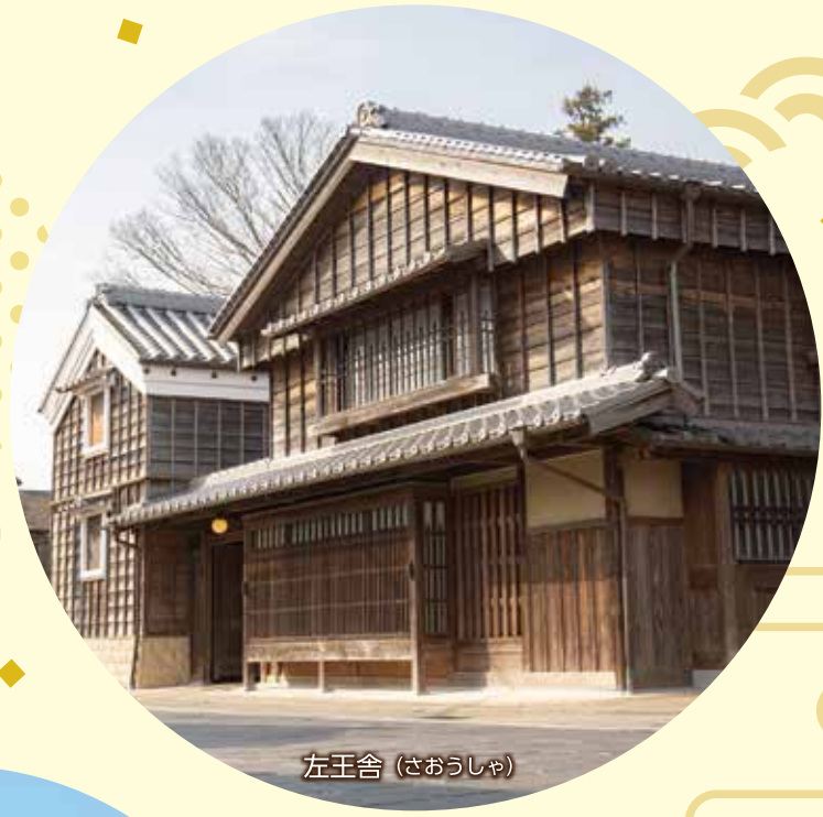
左王舎 (さおうしゃ)