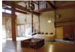
【右王舎】いま・通り土間